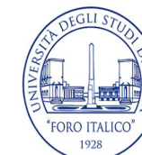
UNIVERSITÀ DEGLI STUDI DI ROMA FORO ITALICO (IT)