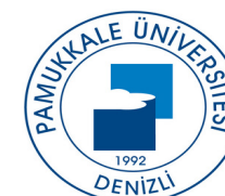
PAMUKKALE ÜNİVERSİTESİ (TUR)